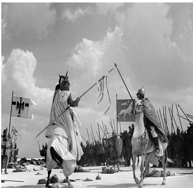
Кадр из фильма С. Эйзенштейна "Александр Невский"

На самом деле Александр Невский к этим словам не имеет никакого отношения – в немногих летописных источниках, которые о нем повествуют ("Софийская первая летопись" и "Псковская вторая летопись"), нет никаких упоминаний ни этих слов, ни других, хотя бы отдаленно на них похожих. Автор этих слов – советский писатель Петр Андреевич Павленко (1899–1951).